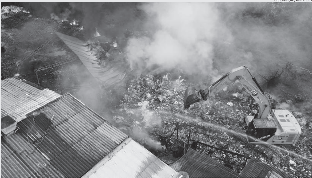
Mais de 100 mil litros de água foi usado para combater incêndio no bairro Moreto

Um galpão de materiais recicláveis localizado no bairro Moreto, em Capivari, foi consumido por um incêndio na madrugada do último sábado (17). O fogo exigiu uma resposta imediata das autoridades locais, mobilizando pelo menos cinco viaturas do Corpo de Bombeiros, Defesa Civil, SAAE (Serviço Autônomo de Água e Esgoto) e Guarda Civil da cidade.